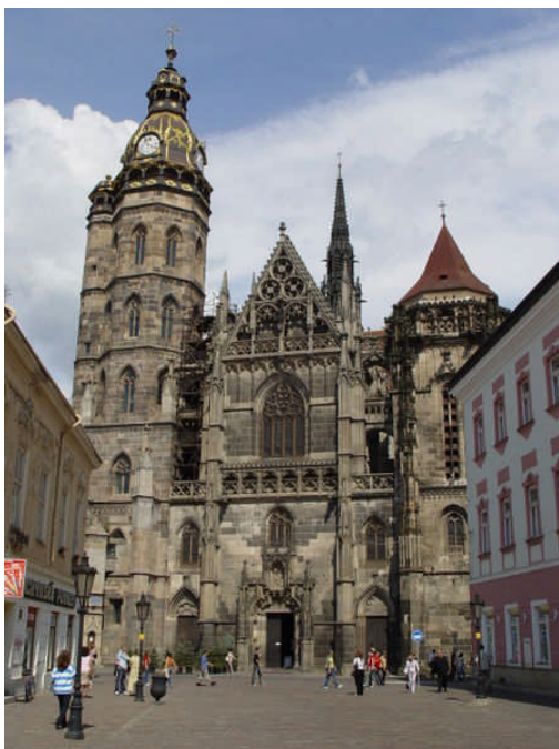
Košice, La Cathédrale Sainte Elizabeth